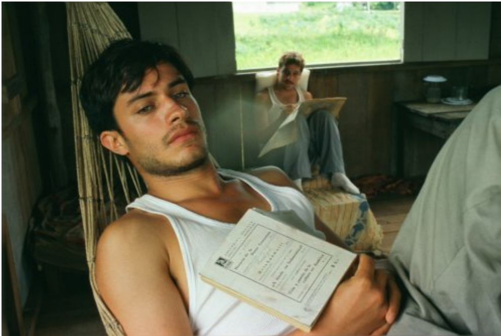
El actor mexicano Gael García Bernal

Apellidos : García Bernal Nombre : Gael Nació : 30 de octubre de 1978 Lugar : Guadalajara, Jalisco. Idiomas : Español (materno), inglés, francés e italiano