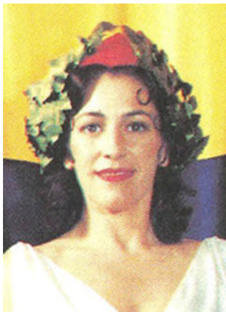
Foto 1: Carmela (Carmen Maura) personificando la figura femenina de la II República Española, con los colores típicos de la bandera, rojo, amarillo y violeta. ¡Ay Carmela! era el título de una famosísima canción del bando republicano durante la guerra civil. Carmela en la película no tiene una fuerte ideología, se deja más bien llevar por el corazón. Y esto le traerá gravísimos problemas...